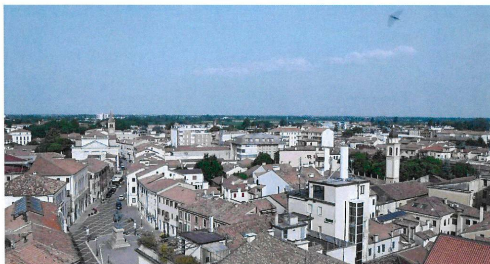
Uno scorcio di Piazza Garibaldi a Rovigo ripreso dall'alto, in una scena del film

Il regista Sebastiano Rizzo ha definito la permanenza nel nostro territorio "un'esperienza straordinaria, vissuta in prima persona nel riscoprire luoghi straordinari e cercare di renderli al meglio, mostrandoli a quel pubblico che ancora non conosce le bellezze incantevoli del Veneto".