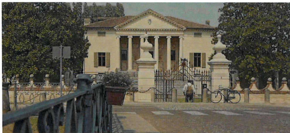
Una scena del film con Totò Onnis davanti a Villa Badoer, a Fratta Polesine.

Lo spunto è dato dalla rievocazione delle esperienze e dei luoghi percorsi dallo scrittore Ernest Hemingway nel nostro territorio veneto , che tanto ha amato, come anche diversi altri artisti, citati nel film: da Petrarca a Goethe e Wilde, passando per Canova, che ci ha lasciato le sue magnifiche ville, tra cui la nostra "Badoera" a Fratta Polesine.