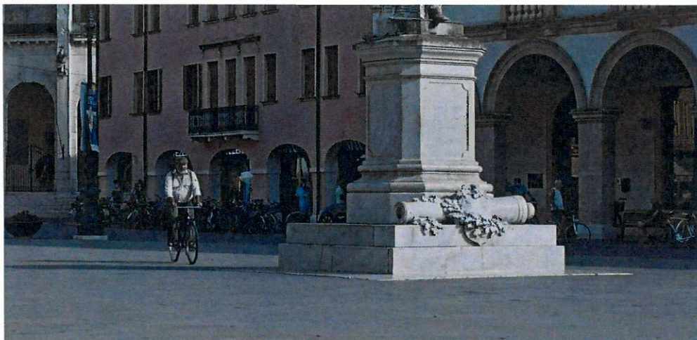
Totò Onnis in piazza Vittorio Emanuele II in una scena del film.