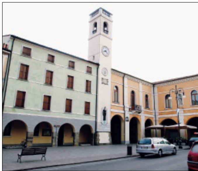
Il Comune di Badia Polesine

"Con la conclusione dell'anno scolastico 2021-2022 - ha ricordato l'assessore Targa - termineranno i contratti di appalto sia per il servizio di trasporto scolastico sia per il servizio mensa. Per il servizio di trasporto scolastico l'intenzione è quella di fare un affidamento diretto di un anno, mentre