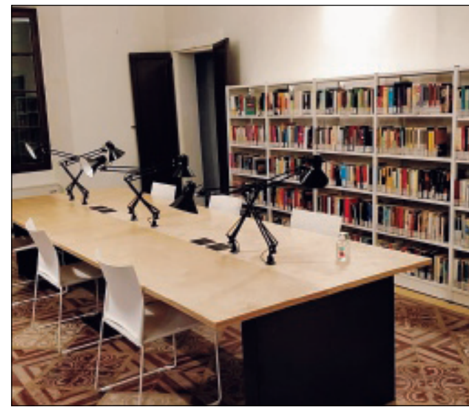
La biblioteca di Badia