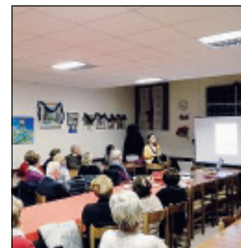
Uno degli incontri informativi organizzati dal Crab