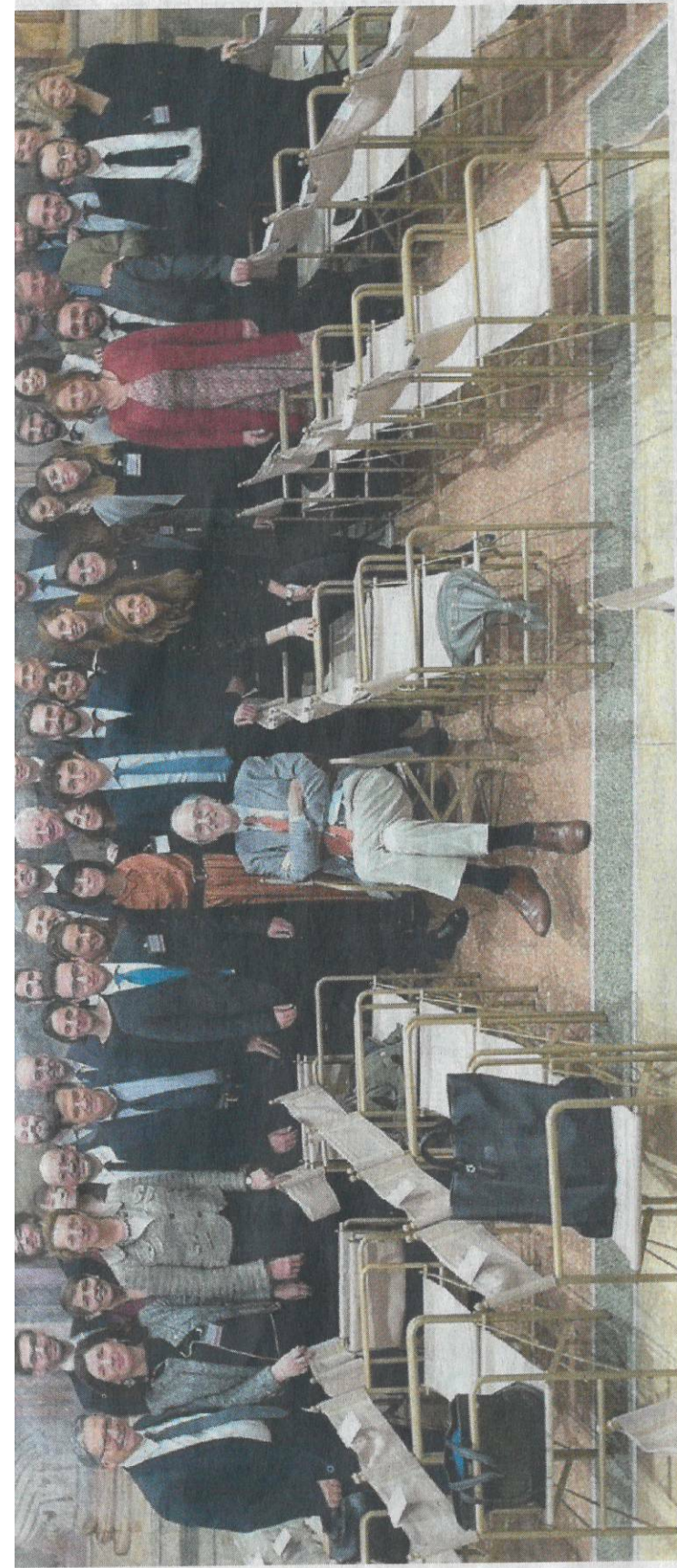
IL GRUPPO Renzo Piano insieme al gruppo di professionisti che operano in GI24, lo studio che il grand architetto finanzia con lo stipendio di senatore a vita.